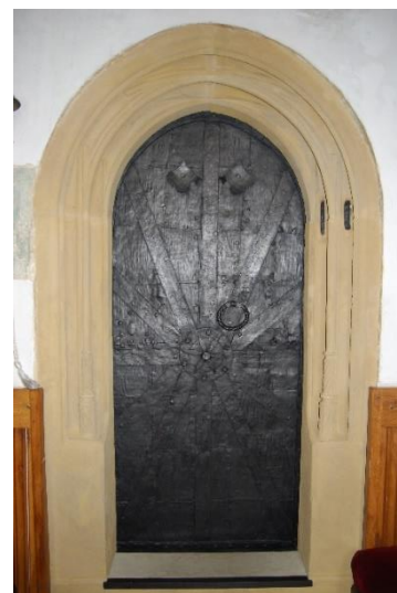
Ilustracja nr 19 Grodziszczce, kościół pw. św. Anny, portal otworu wejściowego zakrystii z I poł. XVI w.

Poza obiektami sakralnymi do rejestru zabytków wpisane są wyłącznie dwa zespoły zabytków ruchomych, będących wyposażeniem pałaców w Krzyżowej oraz Wiśniowej. Elementami wystroju zewnętrznego i wewnętrznego rezydencji w Krzyżowej figurującymi w rejestrze: barokowy portal wejścia głównego, balustrada neobarokowa schodów głównych; sztukaterie neorokokowe hallu; sztukaterie neorokokowe w sali na parterze; kominek neobarokowy w