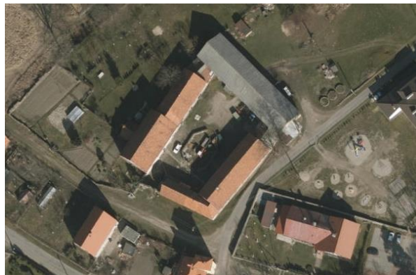
Ilustracja nr 16 Słotwina, zagroda nr 81 oraz Grodziszczu, zagroda nr 62