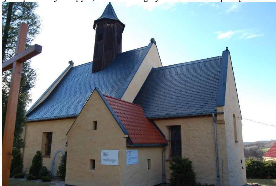
Ilustracja nr 14 Kościół w Modliszowie, widok od południa

Modliszów , kościół filialny pw. św. Bartłomieja. Wzmiankowany po raz pierwszy w 1318 r. W II poł. XIV w. w miejscu pierwszej świątyni, wzniesiono gotycki kościół. W początku XVI w. kościół