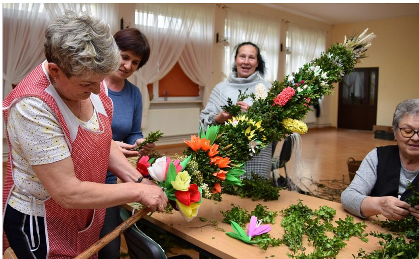
Ilustracja nr 21 Panie z KGW w Lutomi Dolnej przy pracy

Panie z Koła Gospodyń Wiejskich w Lutomi Dolnej jeżdżą na przeglądy i biorą udział w konkursie na „Najpiękniejszą Palmę i Pisanek Wielkanocną” w Jeleniej Górze, gdzie co roku odbywa się „Prezentacja Tradycyjnych Stołów Wielkanocnych, Palm i Pisanek”. Również Świdnicki Ośrodek Kultury organizuje konkursy na palmy wielkanocne.