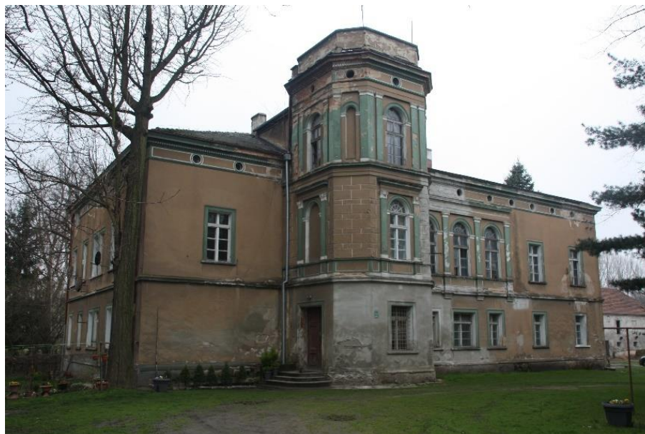
Ilustracja nr 11 Pałac w Wilkowie, widok od wschodu

kondygnacji płytka loggia zaakcentowana pilastrami, pomiędzy którymi trzy otwory okienne zamknięte łukiem pełnym. Dekoracja architektoniczna bogata m.in. w postaci gzymsów międzykondygnacyjnych, rozbudowanego gzymsu koronującego, profilowanych opasek okiennych i drzwiowych. W znakomitej większości zachowała się oryginalna stolarka okienna i drzwiowa.