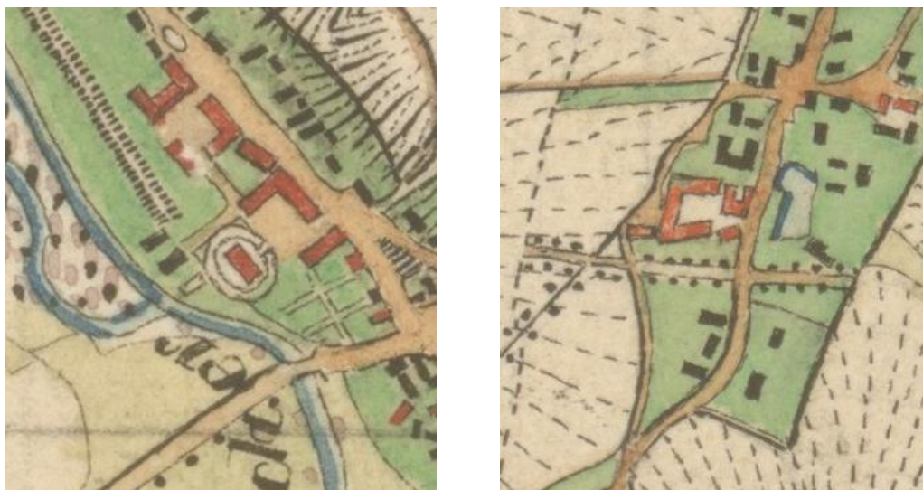
Ilustracja nr 4 Założenia w Wilkowie i Gogołowie na mapie Preußische Urmesstischblätter

W XVI stuleciu ukształtowała się struktura przestrzenna folwarku feudalno-pańszczyźnianego, w skład którego wchodziła siedziba właściciela tj. dwór lub pałac, oraz zespół zabudowy folwarcznej. Późnogotyckie i renesansowe dwory były przebudowywane i rozbudowywane, ich wygląd ulegał przeobrażeniom zgodnie z obowiązującymi aktualnie trendami. W dobie baroku w otoczeniu rezydencji pojawiają się parki i ogrody. Najlepszym i najpełniej zachowanym przykładem z tego okresu jest zespół pałacowo-parkowy z folwarkiem w Krzyżowej. W XVII stuleciu wniesiono także pałac w Komorowie i dwór w Grodziszczu, barokizacji uległy w tym czasie dwór w Gogołowie, pałac w Grodziszczu i pałac w Witoszowie Dolnym. W kolejnym wieku wzniesiono dwór w Bojanicach, pałac w Boleścinie, dwory w Lutonii Dolnej, pałac i dwór w Mokrzeszowie czy dwór w Wieruszowie. W końcu XIX stulecia pojawiła się nowa forma rezydencji, w tym czasie upowszechniły się wille, które wielkością i formą architektoniczną nie ustępowały pałacom. Ich właścicielami byli m.in. majątni fabrykanci. Na terenie gminy Świdnica obiektami takimi są willa dyrektora cukrowni w Pszennie oraz willa podmiejska w Bystrzycy Górnej.