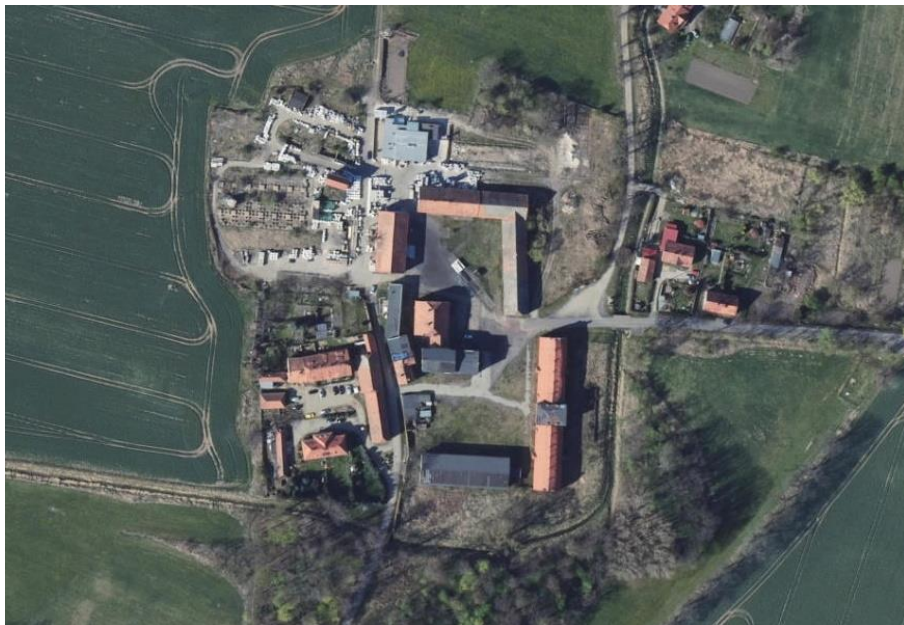
Ilustracja nr 17 Folwark w zespole pałacowo-parkowym z folwarkiem w Komorowie

spośród których część w XIX stuleciu stała się kurortami, istotnym elementem zabudowy są również obiekty hotelowe i pensjonaty.