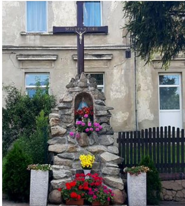
Ilustracja nr 20 Krzyż z Opoczki

Strukturę społeczną mieszkańców wsi tworzą osoby wywodzące się z repatriantów z dawnych Kresów II RP, z Polski Centralnej, Pogórza Karpackiego. Na terenie gminy Świdnica w zasadzie nie ma mieszkańców wywodzących się z rodzin autochtonicznych, więc nie zidentyfikowano we wsi zjawisk i tradycji charakterystycznych dla ludności rodzimej. Mieszkańcy nie znają też legend, historii, pieśni i opowieści związanych z miejscem zamieszkania.