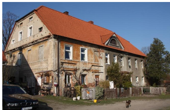
Ilustracja nr 8 Dwór Friedrichshof na ujęciu archiwalnym oraz na fotografii współczesnej