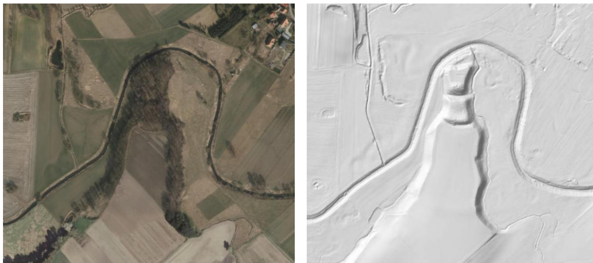
Ilustracja nr 3 Zdjęcie lotnicze oraz wykonane w technologii LIDAR-owej grodziska w Grodziszczu. (źródło: www.geoportal.dolnyslask.pl i www.geoportal.pl ).

W VII w. na terenie Śląska pojawili się Słowianie, z których obecnością wiąże się powstanie systemu administracyjno – obronnego, którego elementami były obronne osady (grodziska). Z okresu