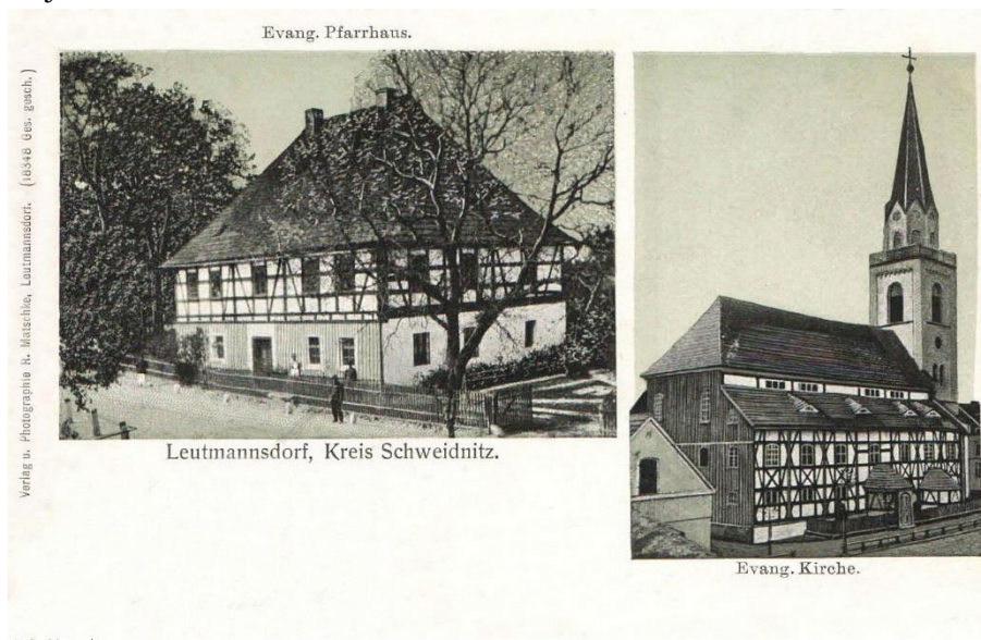
Ilustracja nr 12 Kościół i plebania ewangelicka na pocztówce

stuleciu świątynie takie wzniesiono w Grodziszczu i Lutonii. Niestety do naszych czasów obiekty te nie zachowały się, a jedynym ich reliktem jest murowana wieża z 1857 r., obecnie stanowiąca jeden z wyróżników krajobrazu Lutonii.