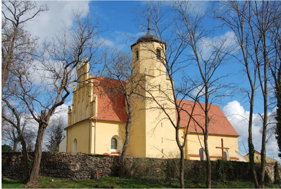
Ilustracja nr 15 Kościół w Mokreszowie, widok od południa