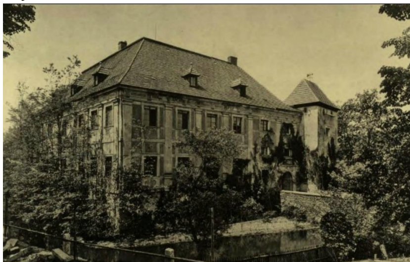
Ilustracja nr 5 Dwór w Pankowie

W XVI stuleciu ukształtowała się struktura przestrzenna folwarku feudalno-pańszczyźnianego, w skład którego wchodziła siedziba właściciela tj. dwór lub pałac, oraz zespół zabudowy folwarcznej. Późnogotyckie i renesansowe dwory były przebudowywane i rozbudowywane, ich wygląd ulegał przeobrażeniom zgodnie z obowiązującymi aktualnie trendami. W dobie baroku w otoczeniu rezydencji pojawiają się parki i ogrody. Najlepszym i najpełniej zachowanym przykładem z tego okresu jest zespół pałacowo-parkowy z folwarkiem w Krzyżowej. W XVII stuleciu wniesiono także pałac w Komorowie i dwór w Grodziszczu, barokizacji uległy w tym czasie dwór w Gogołowie, pałac w Grodziszczu i pałac w Witoszowie Dolnym. W kolejnym wieku wzniesiono dwór w Bojanicach, pałac w Boleścinie, dwory w Lutonii Dolnej, pałac i dwór w Mokrzeszowie czy dwór w Wieruszowie. W końcu XIX stulecia pojawiła się nowa forma rezydencji, w tym czasie upowszechniły się wille, które wielkością i formą architektoniczną nie ustępowały pałacom. Ich właścicielami byli m.in. majątni fabrykanci. Na terenie gminy Świdnica obiektami takimi są willa dyrektora cukrowni w Pszennie oraz willa podmiejska w Bystrzycy Górnej.