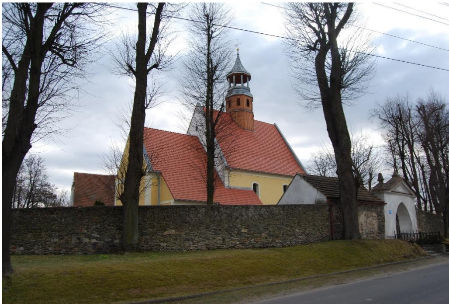
Ilustracja nr 13 Kościół w Grodziszczu, widok od północy

Krzyżowa , kościół filialny pw. św. Michała Archanioła. Pierwsze wzmianki o istnieniu kościoła pochodzą z dokumentów z 1338 r. Obecny wzniesiono w XVI w., po pożarze z 1846 r. odbudowany. Założony na planie prostokąta z nieco węższym i nieznacznie wyższym, zamkniętym prosto prezbiterium, do którego od pñ. przylega założona na planie prostokąta zakrystia. Od zach. wejście poprzedzone kruchtą. Nawa i prezbiterium nakryte dachem dwuspadowym o wspólnej kalenicy w której sygnaturka z ostrosłupowym dachem, zakrystia pulpitowym, kruchta dwuspadowym. Murowany