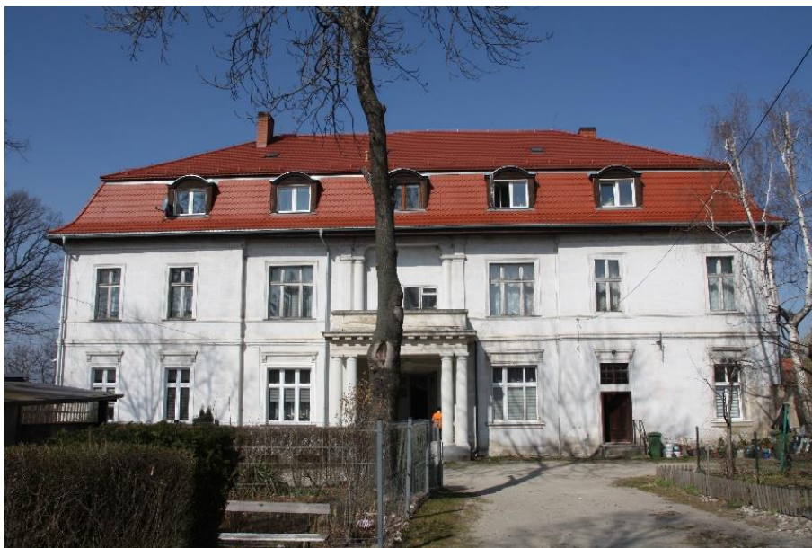
Ilustracja nr 6 Pałac w Boleścinie, widok od południa

Bojanice , dwór. Wzniesiony w k. XIX w. w zespole dworsko-folwarcznym należącym do rodu von Websky. Obiekt pełnił głównie funkcję siedziby zarządcy. Założony na planie wydłużonego prostokąta, dwukondygnacyjny, nakryty dachem mansardowym. Murowany, otynkowany, elewacja zachodnia. docieplona i otynkowana, z pokryciem dachowym z dachówki ceramicznej karpiówki w kolorze ceglastym układanej podwójnie w koronkę. Elewacja wsch. (frontowa) w przyziemiu 7-osiowa, wyżej 6-osiowa, z płytkim ryzalitem w przyziemiu 3-osiowym, wyżej 2-osiowym, zwieńczonym trójkątnym szczytem nakrytym dachem dwuspadowym, w szczycie oculus. Dekoracja architektoniczna w postaci gzymsów międzykondygnacyjnych i koronujących, profilowanych obramień, narożnych lizen i plakiet podokiennych.