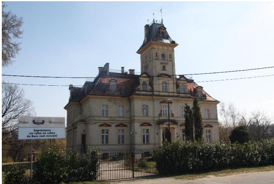
Ilustracja nr 9 Pałac w Makowicach, widok od zachodu

Makowice , pałac. Wybudowany w 1879 r. w dobrach rodu von Websky, być może z wykorzystaniem obiektu wcześniejszego. Wzniesiony w stylu francuskiego neorenesansu w formie dwukondygnacyjnego prostopadłościanu z ryzalitami na osi, przykryty dachem czterospadowym ze świetlikiem nad częścią centralną, o wolutowych lukarnach w połaciach dachowych. Murowany z cegły, otynkowany, z pokryciem dachowym z dachówki ceramicznej karpiówki ułożonej w łuskę. Elewacja frontowa od zach. 7-osiowa, z 3-osiowym ryzalitem, nad którym czworoboczna, trójkondygnacyjna wieża nakryta dachem czterospadowym pobitym blachą układaną na rąbek stojący z lukarną w połaci zach. Główne wejście w osi środkowej, otwór poprzedzony kolumnowym portalem zwieńczonym belkowaniem i tympanonem. Elewacja wsch. komponowana analogicznie. Ryzalit po stronie wsch. zamknięty 3-osiową, dwukondygnacyjną wolutową facjatą, flankowany cylindrycznymi wieżyczkami. Poprzedza go portyk kolumnowy zwieńczony tarasem dostępnym z piętra oraz taras zakończony półkoliście z jednobiegowymi schodami po bokach. W elewacji półd. balkony po bokach ryzalitu, w elewacji półn. jeden balkon. profilowanych obramieniach zamkniętych trójkątnymi i półkolistymi naczółkami. Powyżej otwory o obramieniach z uszakami i kluczem.