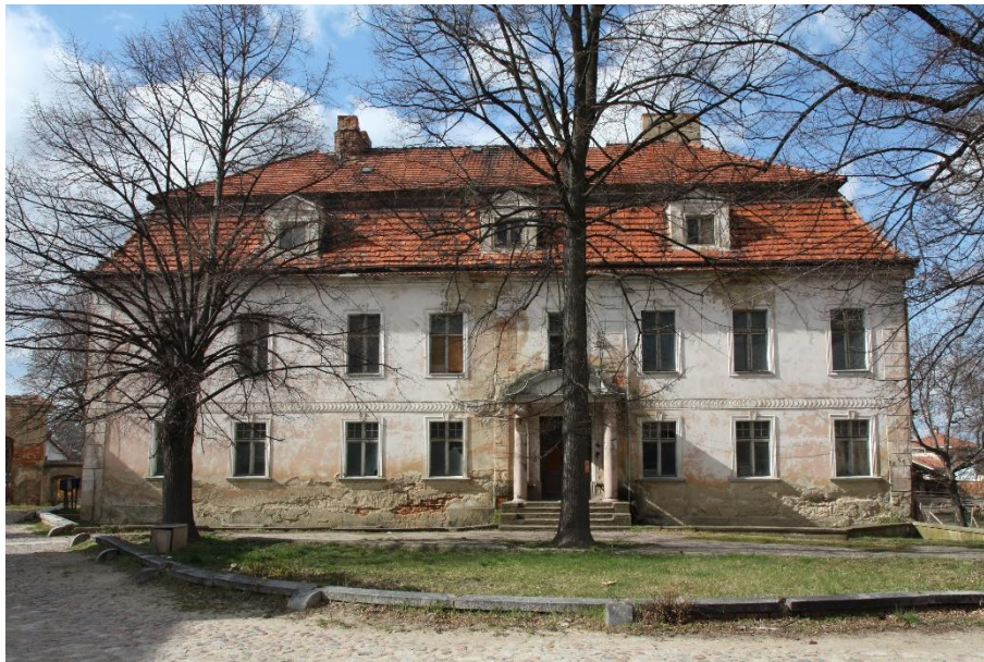
Ilustracja nr 7 Pałac w Komorowie, widok od południa

Komorów , pałac. Obiekt zapewne wzniesiony w XVIII w., przebudowany został ok. 1800 r. Pałac wzniesiony został na planie litery L, dwukondygnacyjny, z wysoką partią piwniczną w szczególności od płn., nakryty dachem mansardowym z połaciach którego lukarny szczytowe. Murowany, otynkowany, z pokryciem dachowym z dachówki ceramicznej karpiówki w kolorze ceglonym układanej podwójnie w koronkę. Elewacja płd. (frontowa) 8-osiowa, z wejściem w osi 5. Przed wejściem portyk kolumnowy wsparty na pilastrach i kolumnach w porządku toskańskim, zwieńczony frontonem w kształcie łuku nadwieszonym pobitym blachą. Dekoracja architektoniczna w formie boniowanych lizen wzmacniających narożniki oraz podkreślających oś 5 w elewacji frontowej, gzymsów międzykondygnacyjnego z motywem cekinowym oraz wydatnego profilowanego gzymsu koronującego, profilowanych obramień otworów okiennych. Stolarka okienna historyczna pochodząca z dwóch faz.