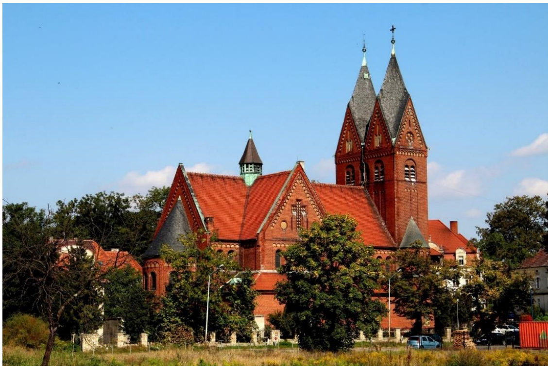
Kościół pw. Niepokalanego Poczęcia NMP

Wzniesiony w latach 1909 - 1911 w stylu neoromańskim według projektu berlińskiego architekta Friedricha Oskara Hossfelda. Jest to bazylika z transeptem i wieżą od strony wschodniej, krótkim prezbiterium oraz półkolistą absydą. Wystrój wnętrza jednolity - neoromański. Ołtarze, ambonę i chrzcielnicę wykonano według projektu Hugo Bürgera. Polichromie na ścianach i suficie oraz witraże są autorstwa braci Ottona i Rudolfa Linnermannów z Frankfurtu n. Menem. Interesującym zabytkiem jest mała figurka Madonny znajdująca się na ścianie nawy południowej. Mimo, że wyrzeźbiona na przełomie XIX/XX wieku, nawiązuje do tzw. Pięknych Madonn - rozpowszechnionych na Śląsku w okresie późnogotyckim. Przed kościołem umieszczono barokową rzeźbę Św. Jana Nepomucena, przeniesioną ze skrzyżowania dróg na zachodnim przedmieściu. W latach 1992-2000 wewnątrz kościoła przeprowadzone zostały prace restauracyjne, odnowione zostały malowidła ścienne i sufitowe.