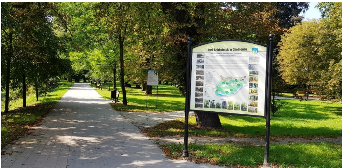
Park Śródmiejski im. Marszałka Józefa Piłsudskiego

W grudniu 2018 r., zgodnie z Uchwałą Nr V/22/18 Rady Miejskiej w Chojnowie, zabytkowemu Parkowi Śródmiejskiemu nadano imię Marszałka Józefa Piłsudskiego.