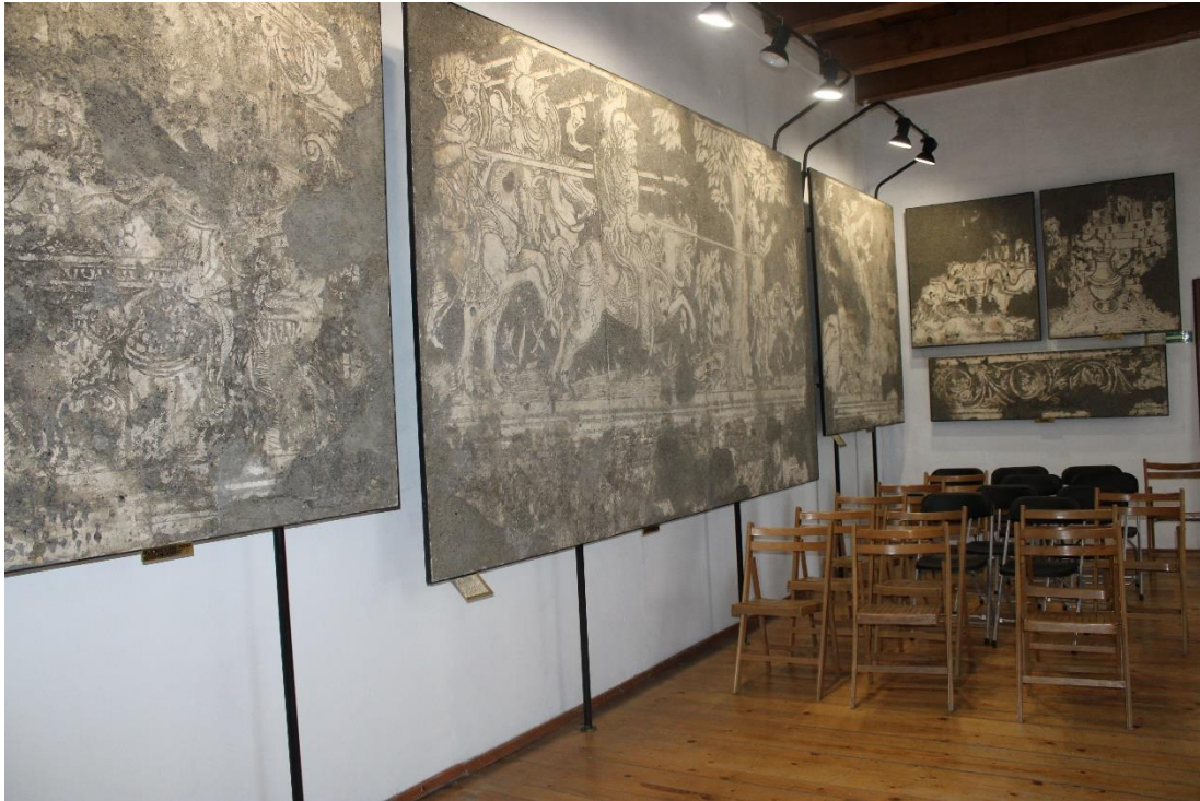
Renesansowe sgraffita z dworu Schellendorfów

Swoje zbiory muzeum prezentuje na wystawach stałych: