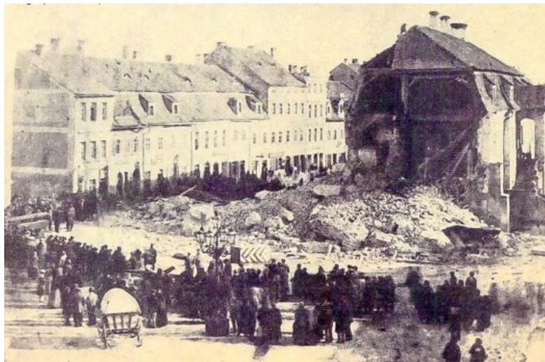
1875: Mieszkańcy Chojnowa zgromadzeni wokół zawalonej wieży ratusza

Nieistniejący dziś ratusz był przez wiele wieków, obok bazyliki, centralną budowlą chojnowskiego Rynku.