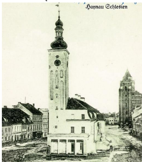
Stary Ratusz przed zawaleniem wieży

Na Rynku zauważalny jest brak ratusza - charakterystycznego elementu miasteczek dolnośląskich.