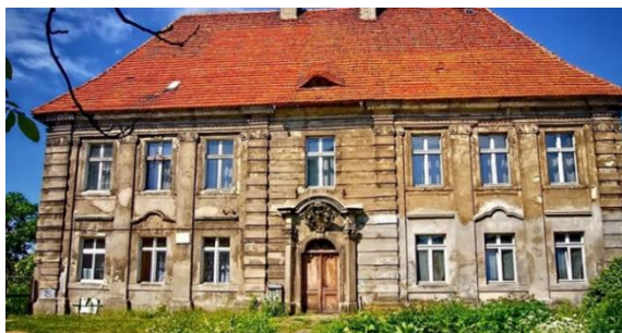
Pałac przy ul. Piotrowickiej

Przy ulicy Bolesławieckiej znajduje się interesujący zabytkowy zespół, późnobarokowy pałac z około 1730 r. z późniejszymi zabudowaniami gospodarczymi. Budowla złożona jest na rzucie prostokąta, dwukondygnacyjna o stromym dachu.