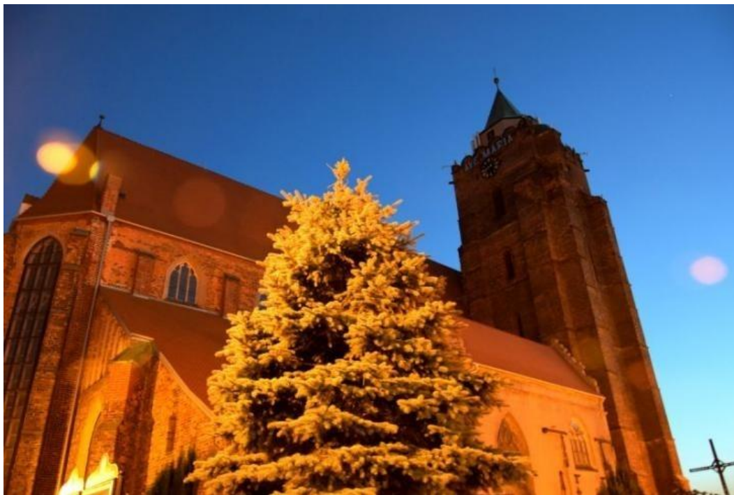
Kościół pw. św. Ap. Piotra i Pawła

Usytuowana we wschodniej stronie rynku ogromna, trzynawowa bazylika zbudowana z cegły, z wystrojem architektonicznym i żebrami sklepiennymi wykonanymi z piaskowca (sklepienia gwiazdziste) jest jednym z przykładów gotyckiego budownictwa na Dolnym Śląsku. Historia kościoła zaczęła się pod koniec XIII wieku. Z 1299 r. pochodzi wzmianka o proboszczu chojnowskim, co wskazuje na istnienie w owym czasie pierwszego kościoła w mieście, którego budowa była kontynuowana na przełomie XIV i XV wieku. W 1400 r. ufundowano ołtarz główny, w 1405 r. zawieszono na wieży duży dzwon, a w 1413 r. wymurowano chór kościelny i budowano prezbiterium. Całość nakryto sklepieniem gwiazdzistym. Na wystrój ówczesnej świątyni składało się 8 ołtarzy. W ciągu wieków kościół ulegał dalszej rozbudowie. Z 1469 r. pochodzi wzmianka o południowej kaplicy ufundowanej przez cech sukienników. W XVI wieku dobudowano zakrystię oraz wykonano zwieńczenie attykowe wieży. W roku 1543 rodzina Bożywojów ufundowała kaplicę grobową, zwaną odtąd północną Kaplicą Bożywojów. W 1617 r. w krypcie świątyni pochowano księżną Annę Wirtemberską.