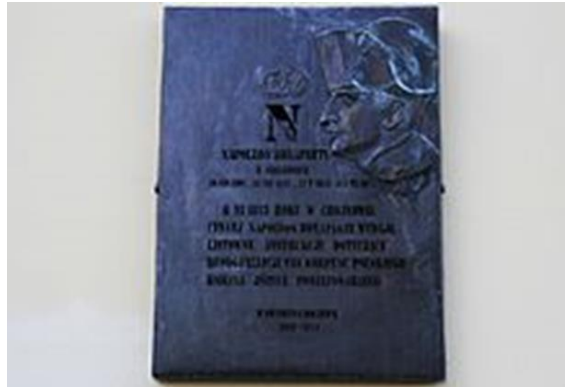
Tablica na budynku Muzeum Regionalnego upamiętniająca pobyt Napoleona Bonaparte w Chojnowie

Pod koniec XVIII i na początku XIX wieku rzemiosłem dominującym było sukiennictwo, które stanowiło główne źródło utrzymania znacznej części ludności Chojnowa. Na przykład w 1788 r. liczba ludności wzrosła do 2076 osób, (w 1742 było to 400 mieszkańców). W związku z rozwojem sukiennictwa działalność rozpoczęła zawodowa szkoła sukiennictwa i z funduszków państwowych wybudowano magazyn wełny.