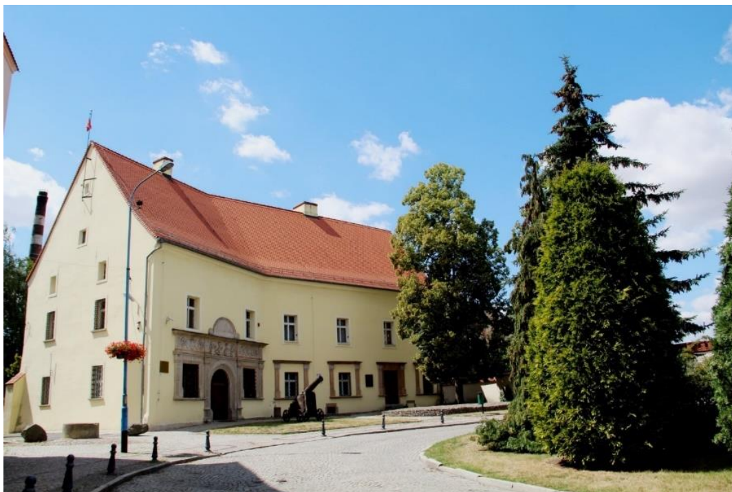
Zamek Piastów Legnicko-Brzeskich

Po 1945 roku zdewastowany i opuszczony zamek został odbudowany z inicjatywy społeczeństwa. W ten sposób uratowano od ostatecznego zniszczenia cenny pomnik renesansowej sztuki. Odbudowę prowadzono w latach 1957 - 1959 przeznaczając zamek na Muzeum Regionalne. W 1962 r. prowadzono w obrębie zamku prace wykopaliskowe. Z gruzowiska wydobyto niespodziewanie interesujące pamiątki: skorupy naczyń stołowych i kuchennych oraz 13 kafli całych lub częściowo zniszczonych. Zachowany do czasów dzisiejszych fragment zamku to budowla dwuskrzydłowa, dwukondygnacyjna, przykryta stromym dachem. W fasadzie frontowej zachowała się renesansowa, niezwykle cenna dekoracja portalu i obramień okiennych, wykonana w piaskowcu w 1547 roku. Nad portalem znajduje się szeroki fryz, w którym umieszczono popiersia: fundatora - księcia Fryderyka III legnickiego i jego żony Katarzyny.