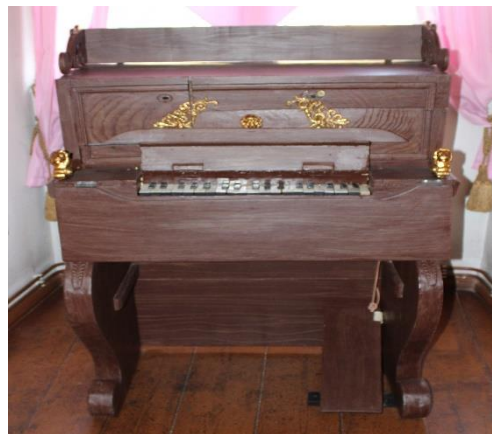
Zabytki Muzeum Regionalnego