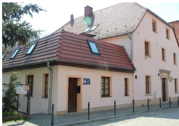
Plebania przy ul. Ściegiennego

Po zniszczeniach II wojny światowej w 1960 r. budynek przekształcono na Bibliotekę Miejską, a od 2001 r. należy do Rzymskokatolickiej Parafii pw. Św. Apostołów Piotra i Pawła. Zachowała się pierwotna bryła budynku, dwukondygnacyjna, ceglana. Wnętrza mają układ dwutraktowy. Na ścianach sieni i nad wejściem do piwnicy zachowały się pozostałości średniowiecznych fresków, w sali na parterze pozostało oryginalne, późnogotyckie sklepienie krzyżowe wsparte na wielobocznym filarze oraz kamienna i profilowana poręcz na kształt żebra.