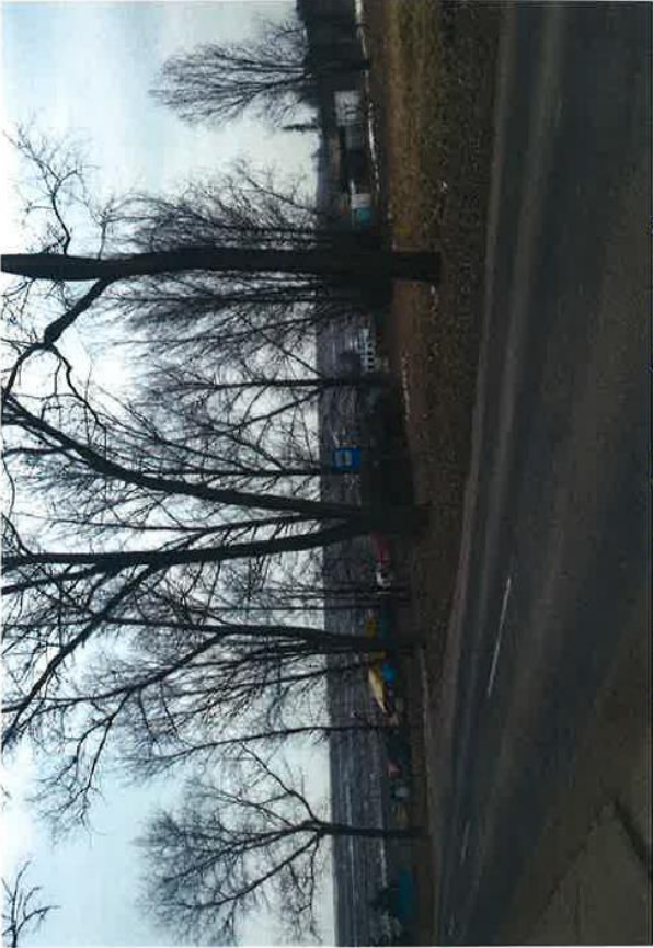
ok. 323 Nr 32 Niemce