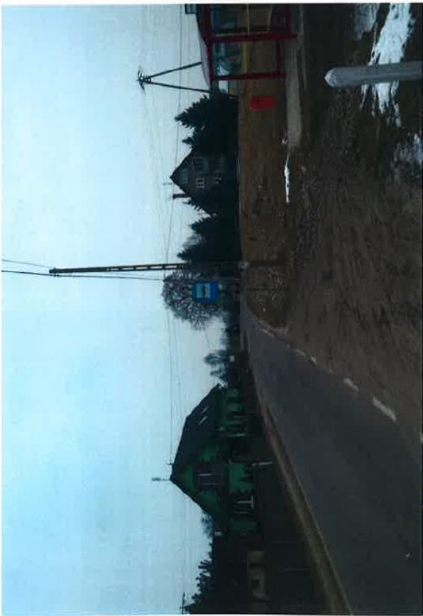
ok. 323 Nr 33 i 34 Studzienki