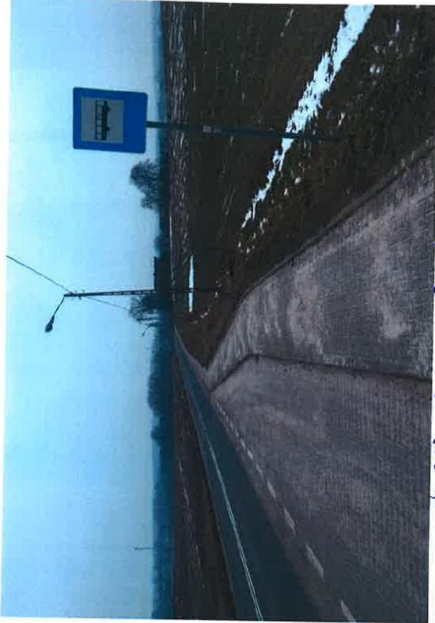
dr. 323 Nr 41 Lubów