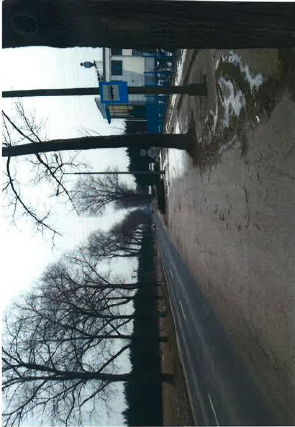
ds. 323 nr 16 Dymarskie I