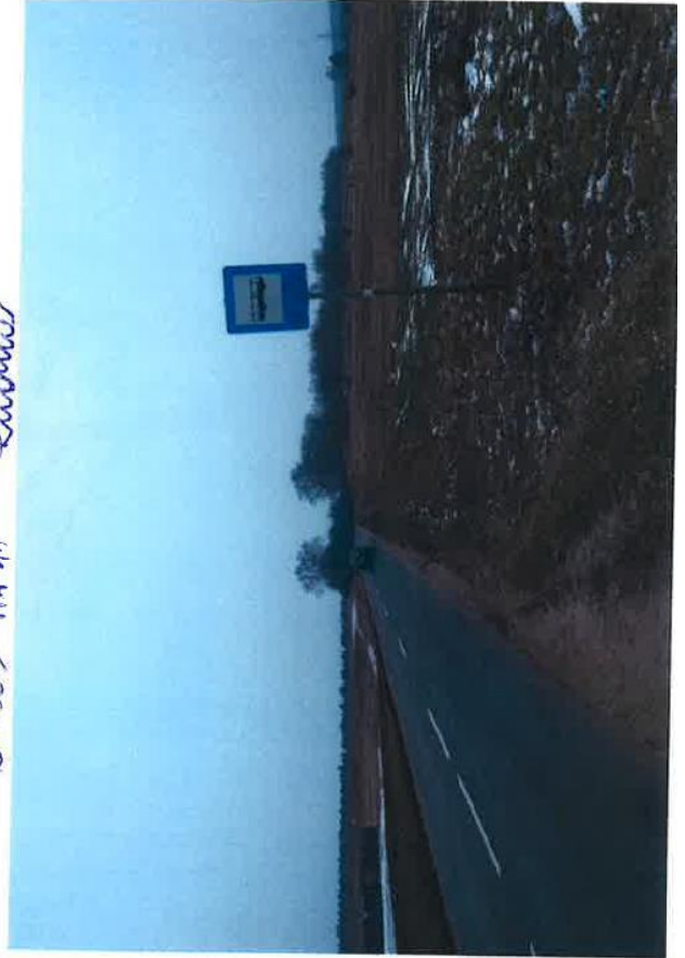
dr. 323 Nr 41 Lubów