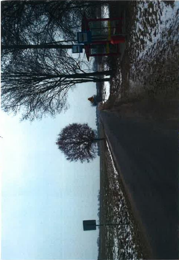
dr. 323 Nr 30 Radoszyce