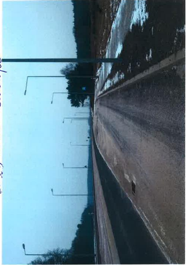
dr. 323 Nr 30 Radoszyce