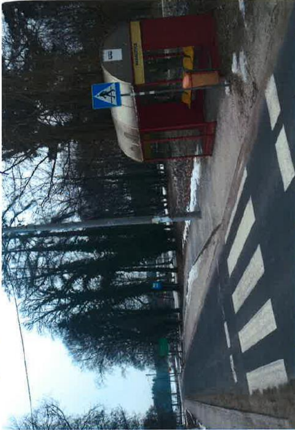
dr. 292 Nr 49 Chodzież Suwalska