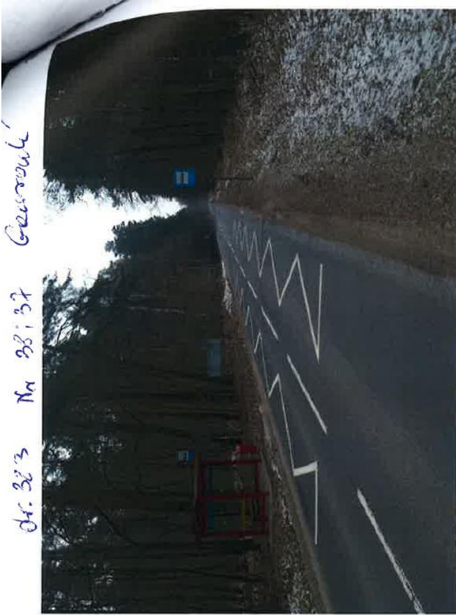
Dr. 323 Nr 38 i 37 Garsmole