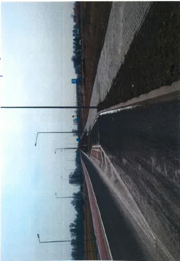
dr. 323 Nr 31 Niemce