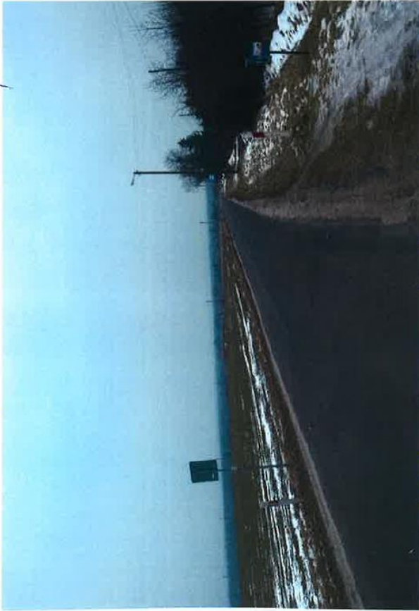
dr. 292 Nr 50 Chodzież Suwalska