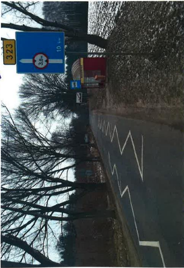
ds. 323 nr 18 Dymarskie II