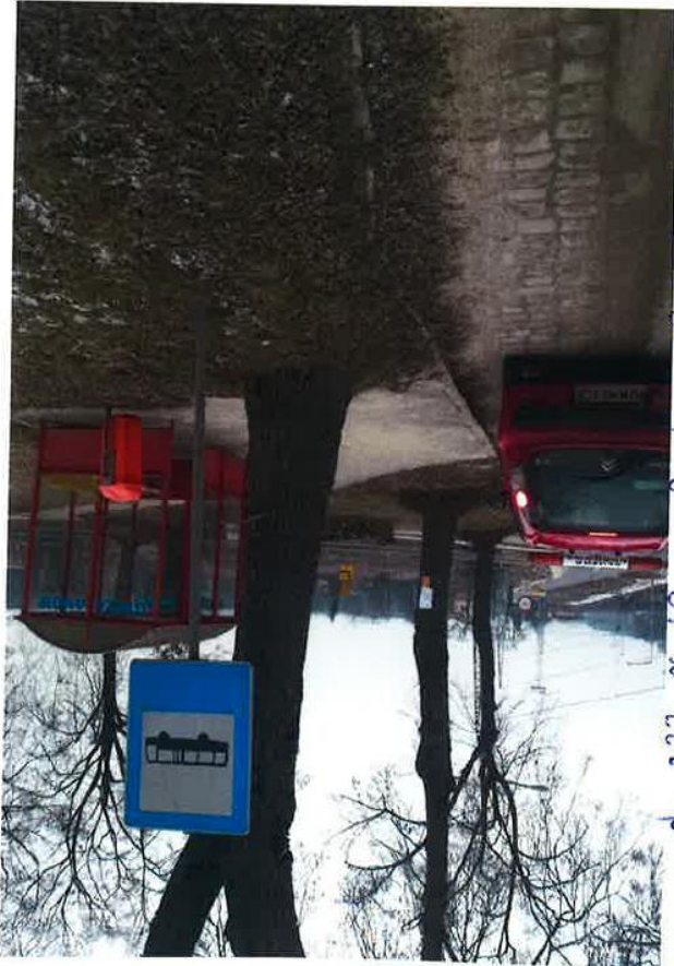
dr. 323 Nr 40 Lubów Giszowice