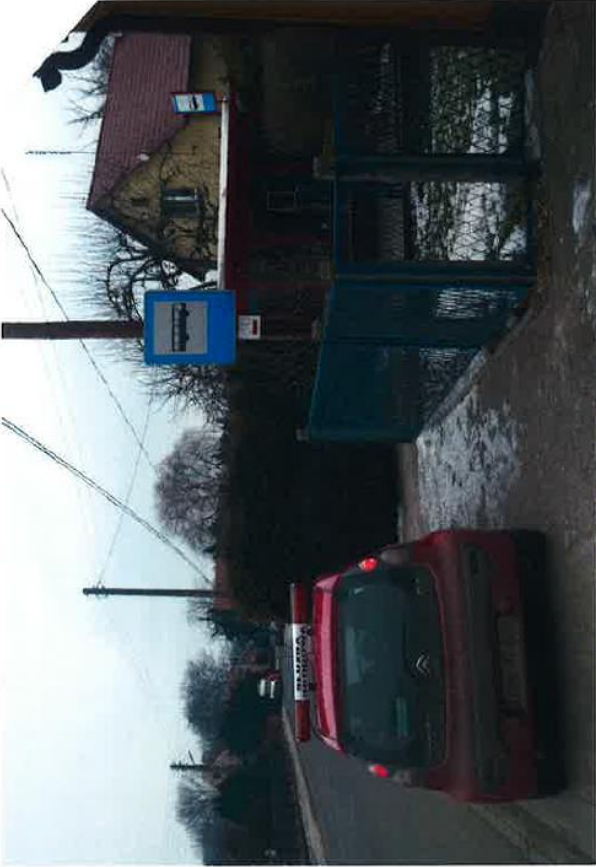
dn. 323 Nr 49 Ruwanice III