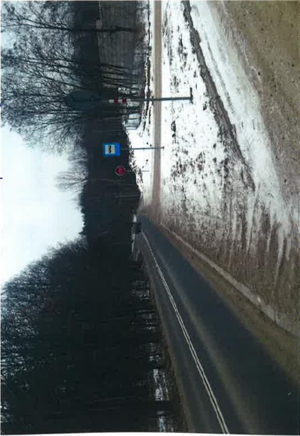
dn. 322 Nr 55 Brechowitz