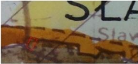
WYRYS ZE STUDIUM UWARUNKWAŃ I KIERUNKÓW ZAGOSPODAROWANIA PRZESTRZENNEGO GMINY GÓRA