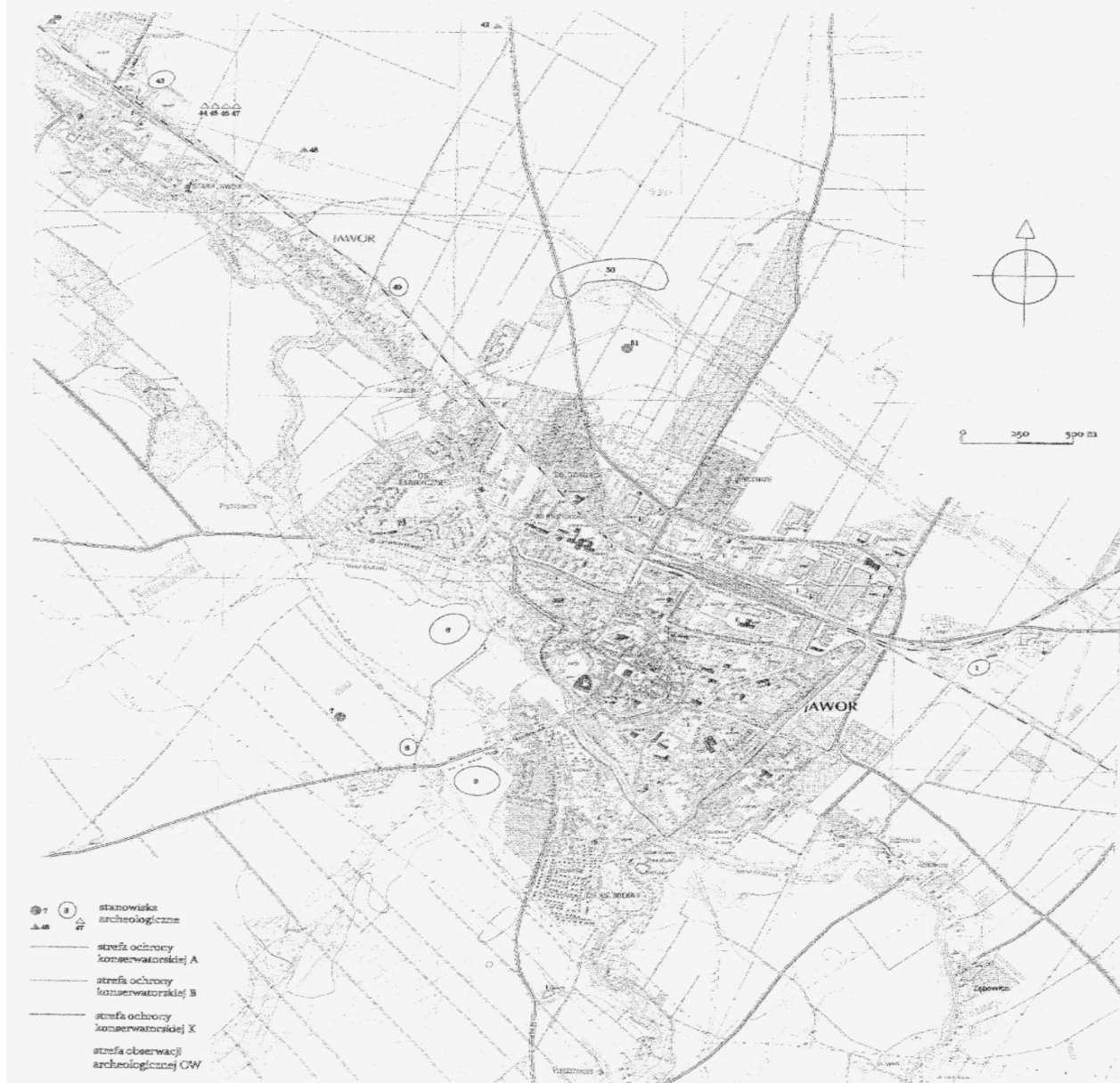
Mapka przedstawiająca strefy ochrony konserwatorskiej oraz stanowiska archeologiczne dotyczące gminy Jawor.

Strefy ochrony konserwatorskiej oraz stanowiska archeologiczne przedstawiono na załączonej mapce gminy Jawor.