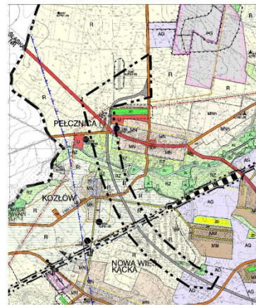
UCHWAŁA RADY MIEJSKIEJ W KĄTACH WROCŁAWSKICH NR LVI/403/2006 Z DNIA 12 PAŹDZIERNIKA 2006R.