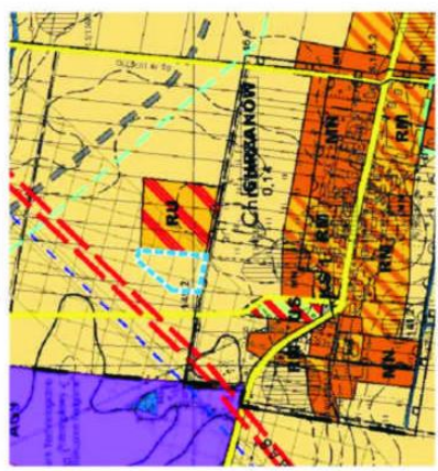
GRANICE OBSZARU OBJĘTEGO PLANEM

WYRYS ZE ZMIANY STUDIUM UWARUNKOWAŃ I KIERUNKÓW ZAGOSPODAROWANIA PRZESTRZENNEGO GMINY KOBIERZYCE wprowadzonej uchwałą Nr XL/506/05 Rady Gminy Kobierzyce z dnia 24 marca 2005r. SKALA 1:10.000