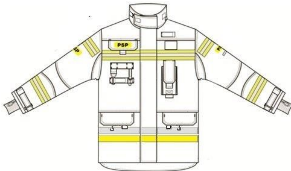
Rys. 1 Widok kurtki z przodu