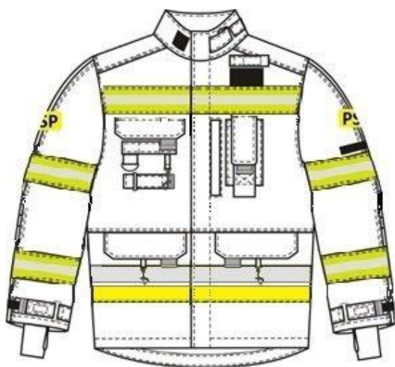
Rys. 5 Widok kurtki lekkiej z przodu