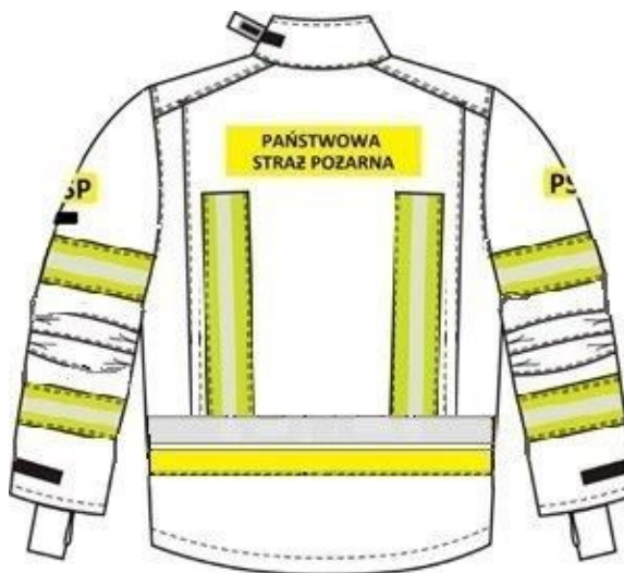
Rys. 6 Widok kurtki lekkiej z tyłu