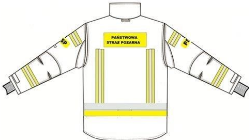
Rys. 2 Widok kurtki z tyłu