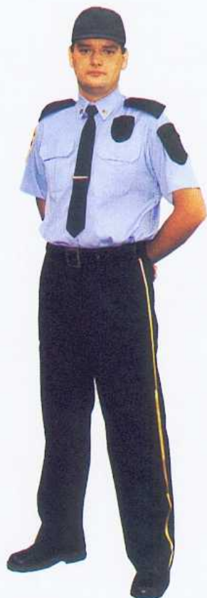
1. Ubiór służbowy letni z czapką typu baseball