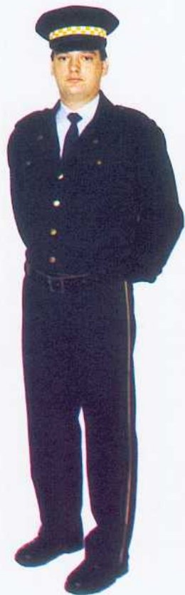
3. Ubiór służbowy letni z wiatrówką