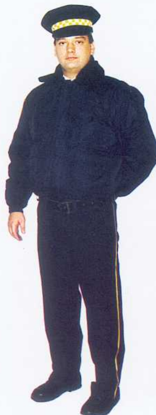
4. Ubiór służbowy zimowy z kurtką uniwersalną krótką