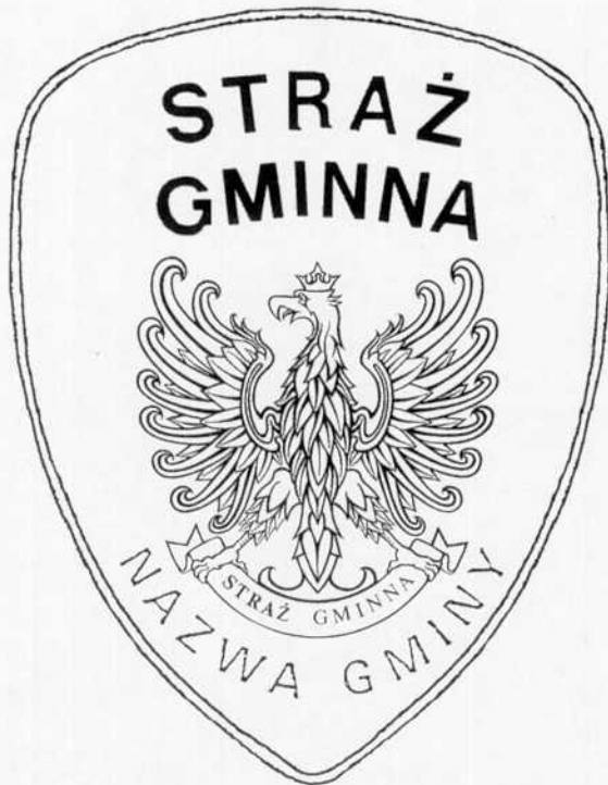
1. Emblemat dla straży gminnej