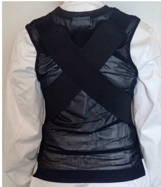
Część przednia (widok od wewnątrz):

Dwie elastyczne taśmy przymocowane do tylnej części: