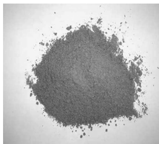
Nuotrauka nr 2