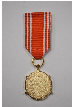
strona odwrotna medalu