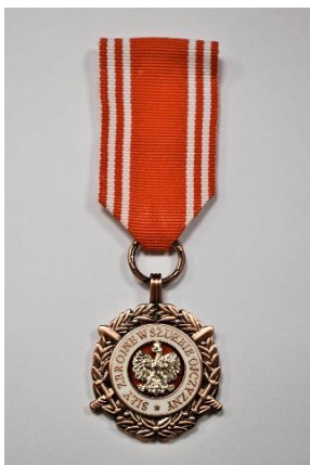
strona licowa medalu