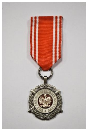
strona licowa medalu