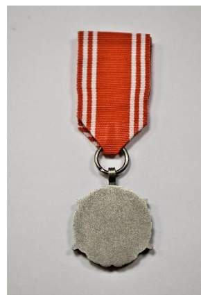
strona odwrotna medalu