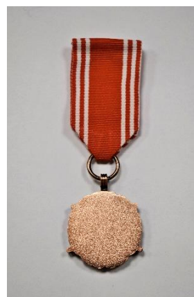
strona odwrotna medalu