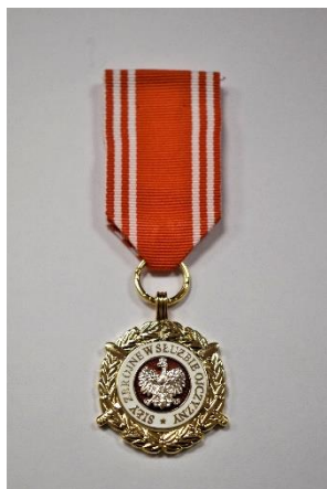
strona licowa medalu