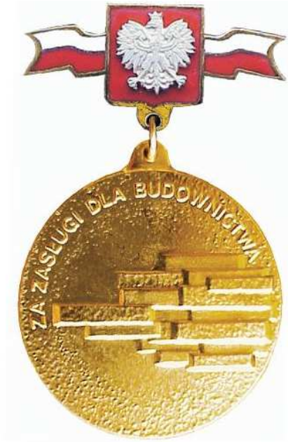
Wzór w powiększeniu