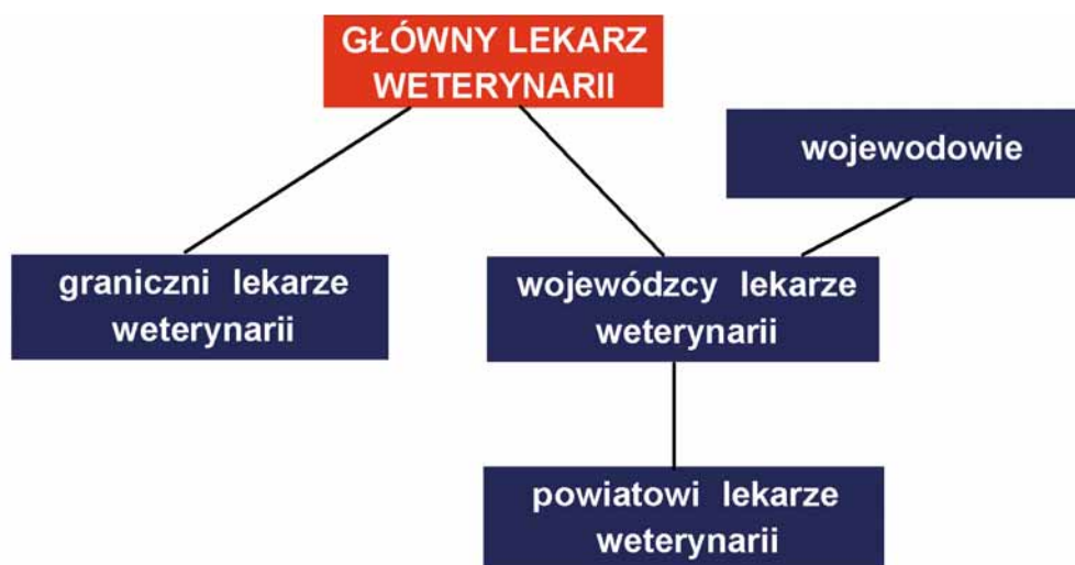
Rys. 2. Schemat organizacji Inspekcji Weterynaryjnej w Rzeczypospolitej Polskiej

Struktura oraz kompetencje organów Inspekcji Weterynaryjnej zostały określone w ustawie z dnia 29 stycznia 2004 r. o Inspekcji Weterynaryjnej (Dz. U. z 2007 r. Nr 121, poz. 842, z późn. zm.).