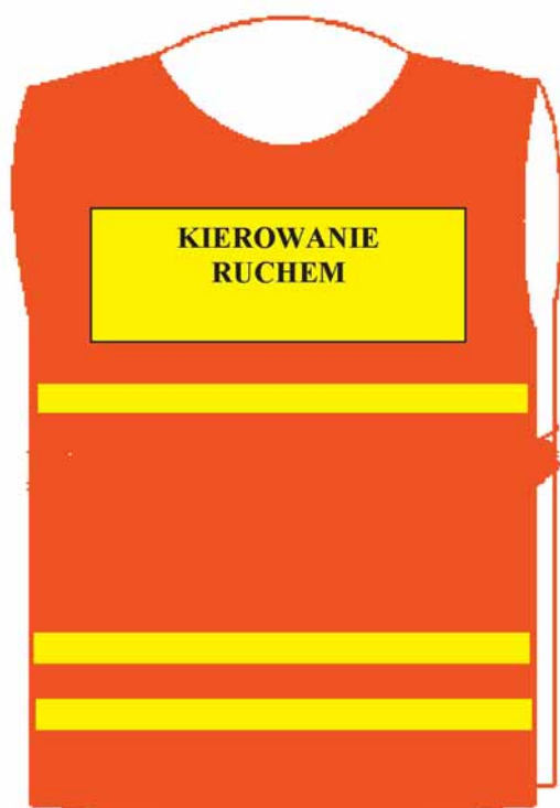
Narzutka — przód