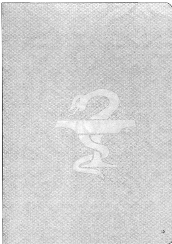
Strona bez nadruku przeznaczona na wpisy uzupełniające

1) po stronie 14 zamiast strony zawierającej „POUCZENIE” powinny być strony 15 i 16 w brzmieniu: