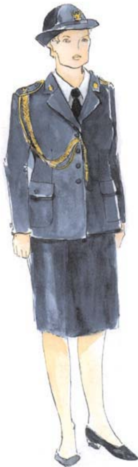
ubiór wyjściowy aspiranta w mundurze wyjściowym ze sznurem galowym