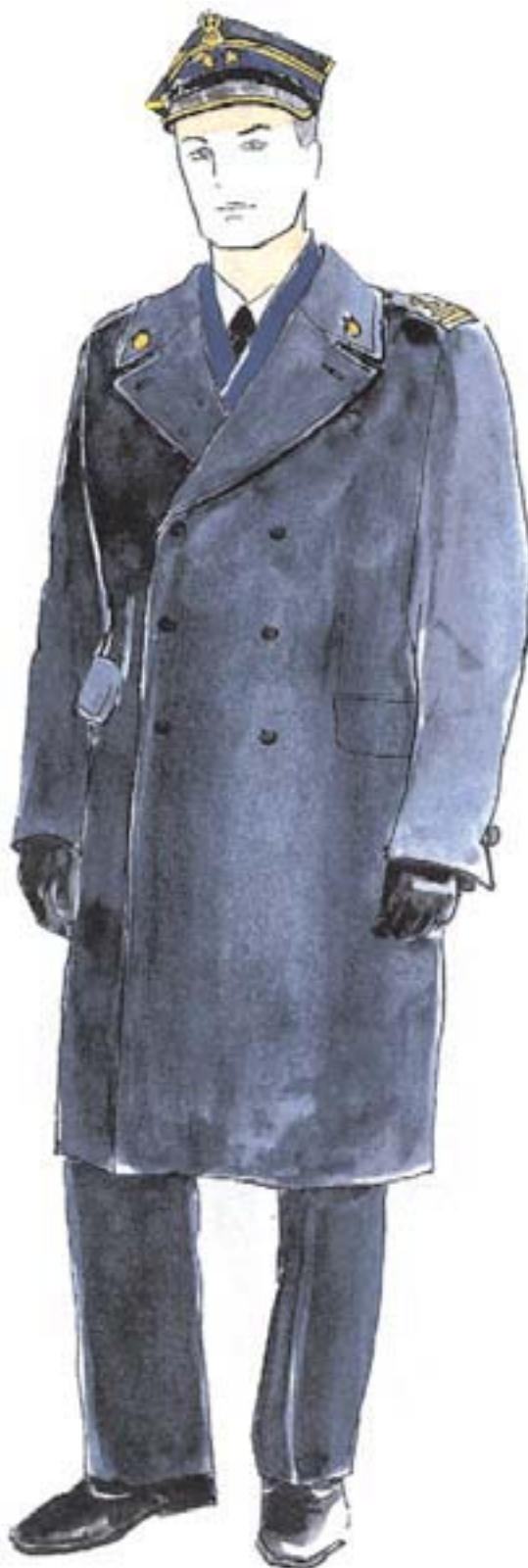
ubiór wyjściowy oficera w płaszczu sukienym