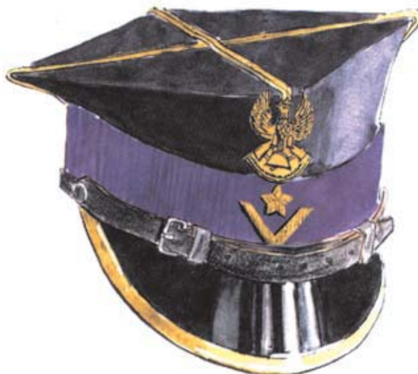
czapka wyjściowa aspiranta