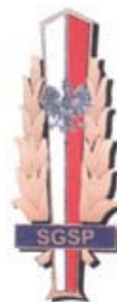
Szkoly Głównej Służby Pożarniczej