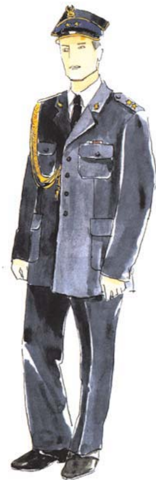
ubiór wyjściowy oficera w mundurze wyjściowym ze sznurem galowym i baretkami