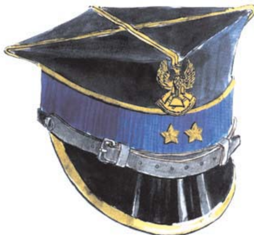
czapka wyjściowa młodszego oficera