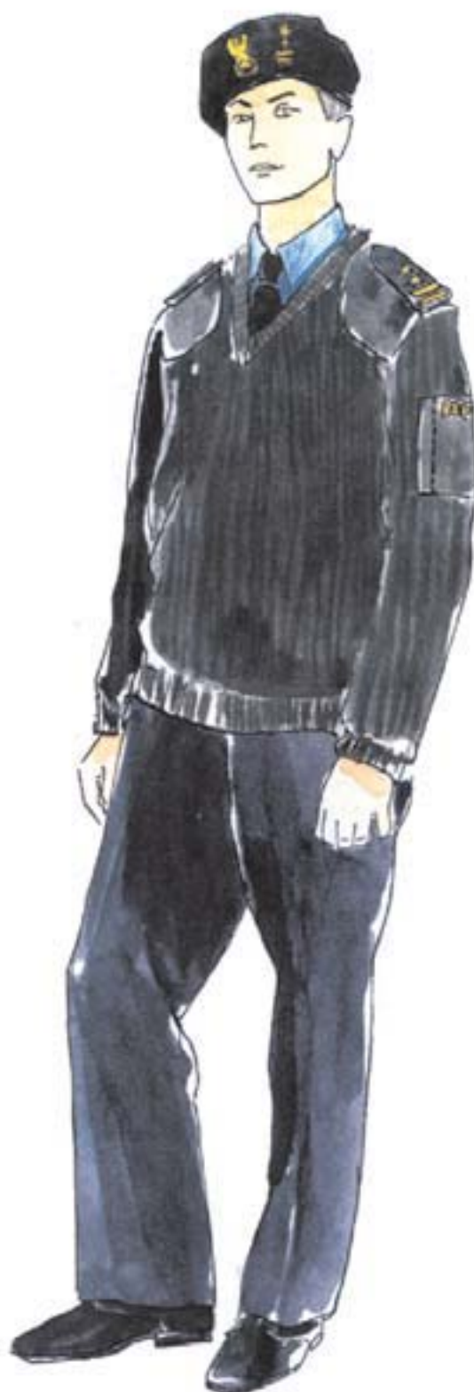
ubiór służbowy oficera w swetrze