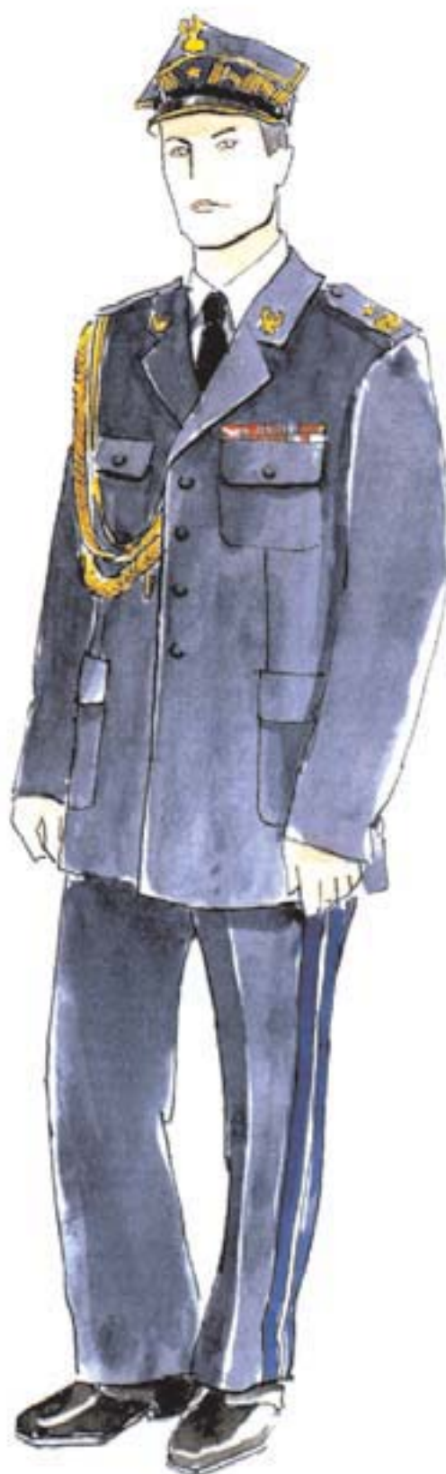
ubiór wyjściowy nadbrygadiera i generała brygadiera w mundurze wyjściowym ze sznurem galowym i baretkami