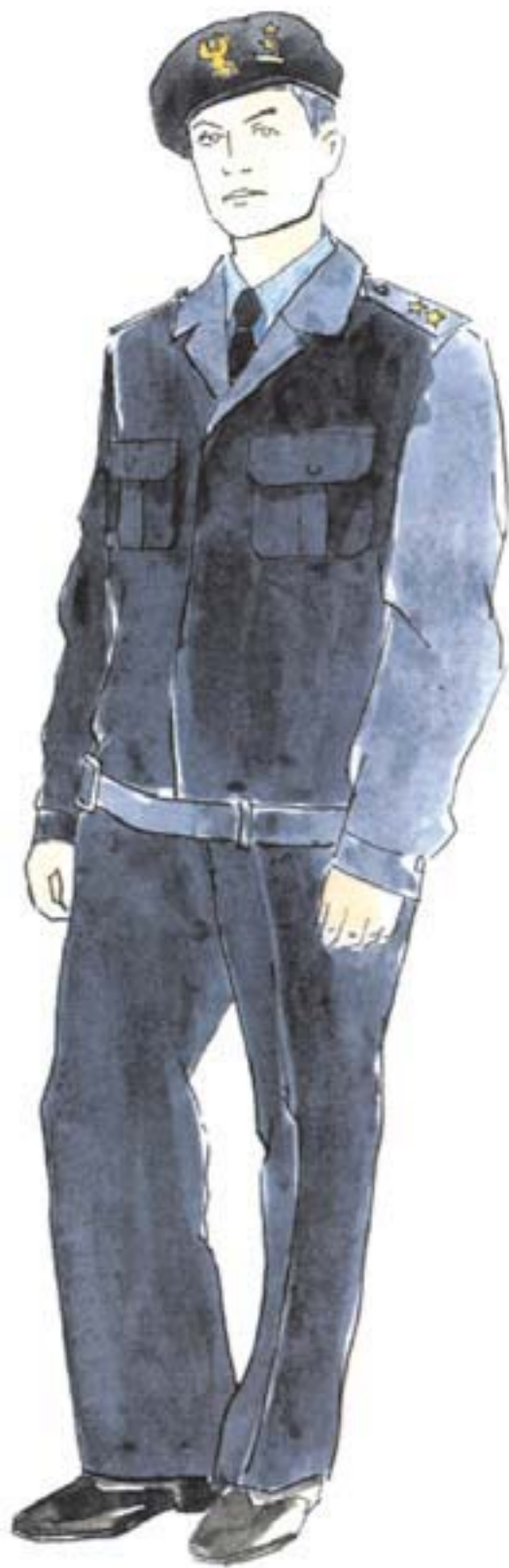
ubiór służbowy oficera w mundurze służbowym