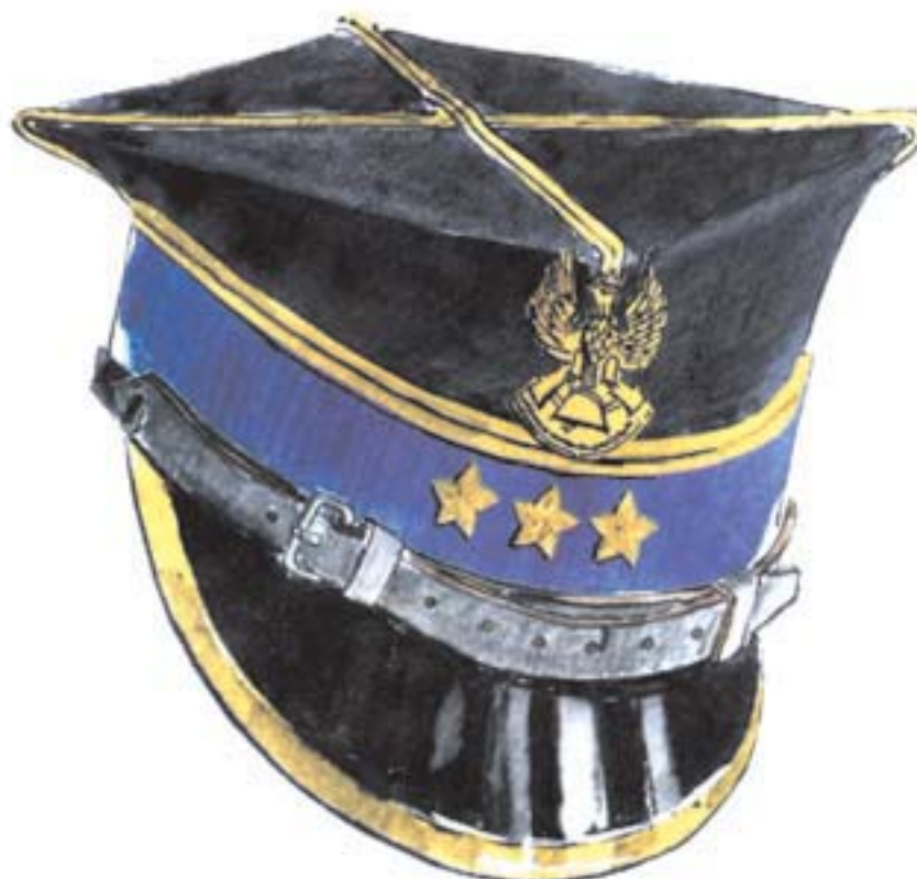
czapka wyjściowa starszego oficera