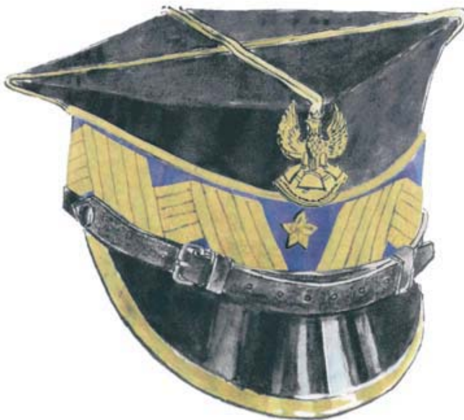
czapka wyjściowa nadbrygadiera