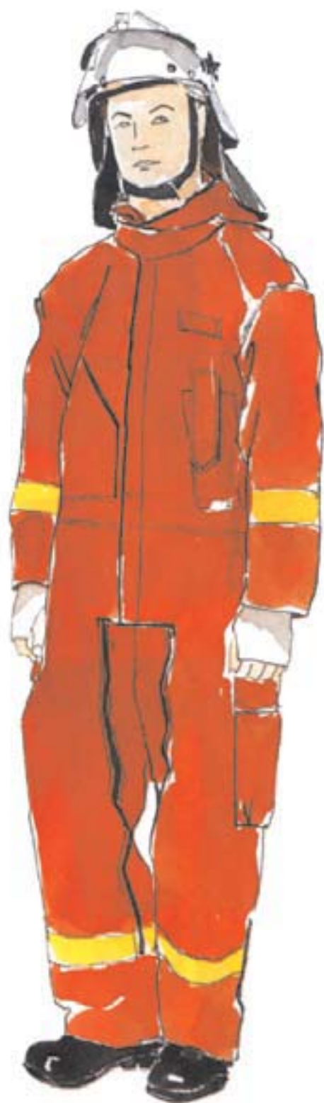
ubranie specjalne jednoczęściowe (kombinezon)