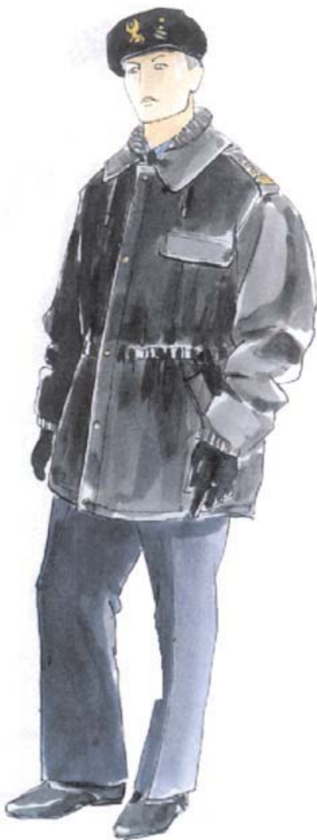
ubiór służbowy oficera w kurtce 3/4