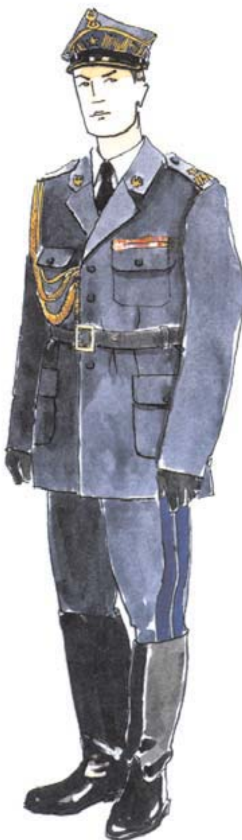
ubiór wyjściowy nadbrygadiera i generała brygadiera ze sznurem galowym, w bryczesach i butach oficerskich