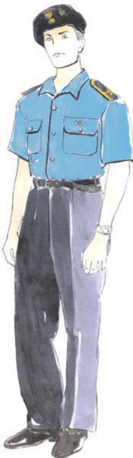
ubiór służbowy podoficera w koszuli z krótkim rękawem