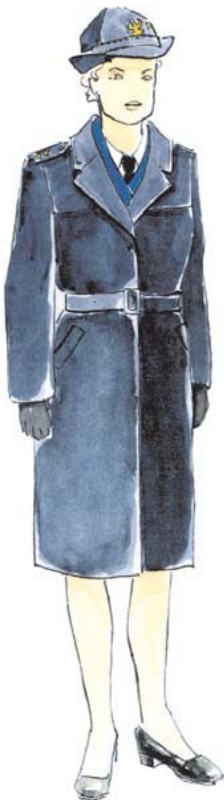
ubiór wyjściowy oficera w płaszczu letnim