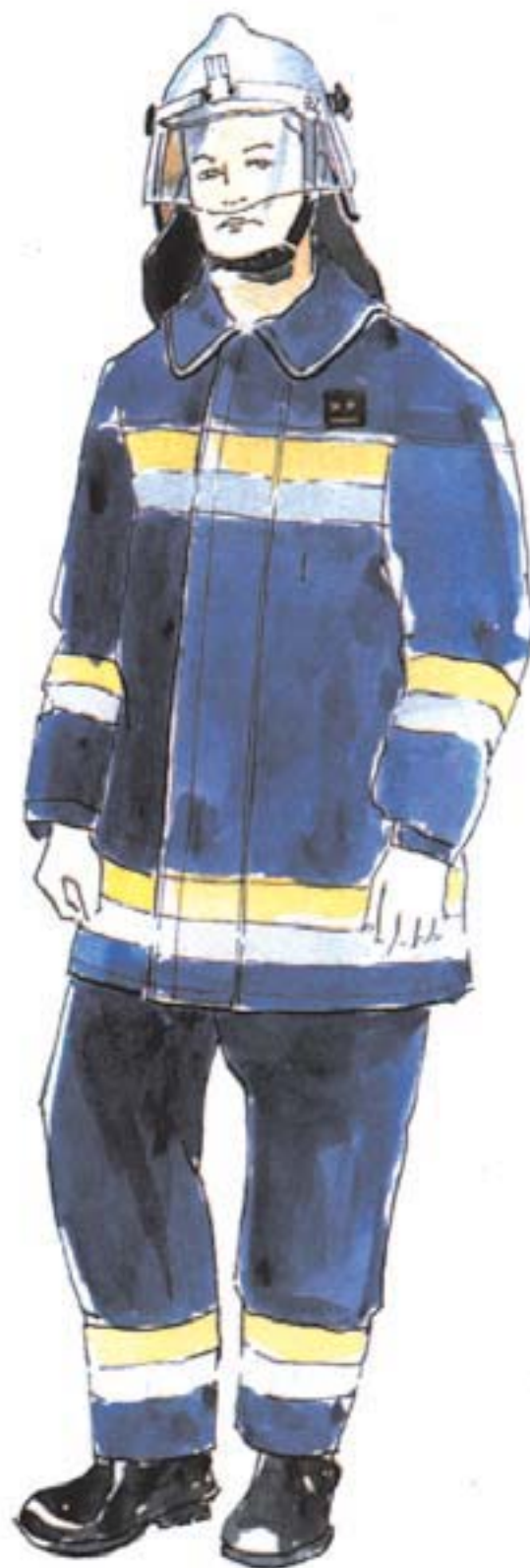
ubranie specjalne dwuczęściowe