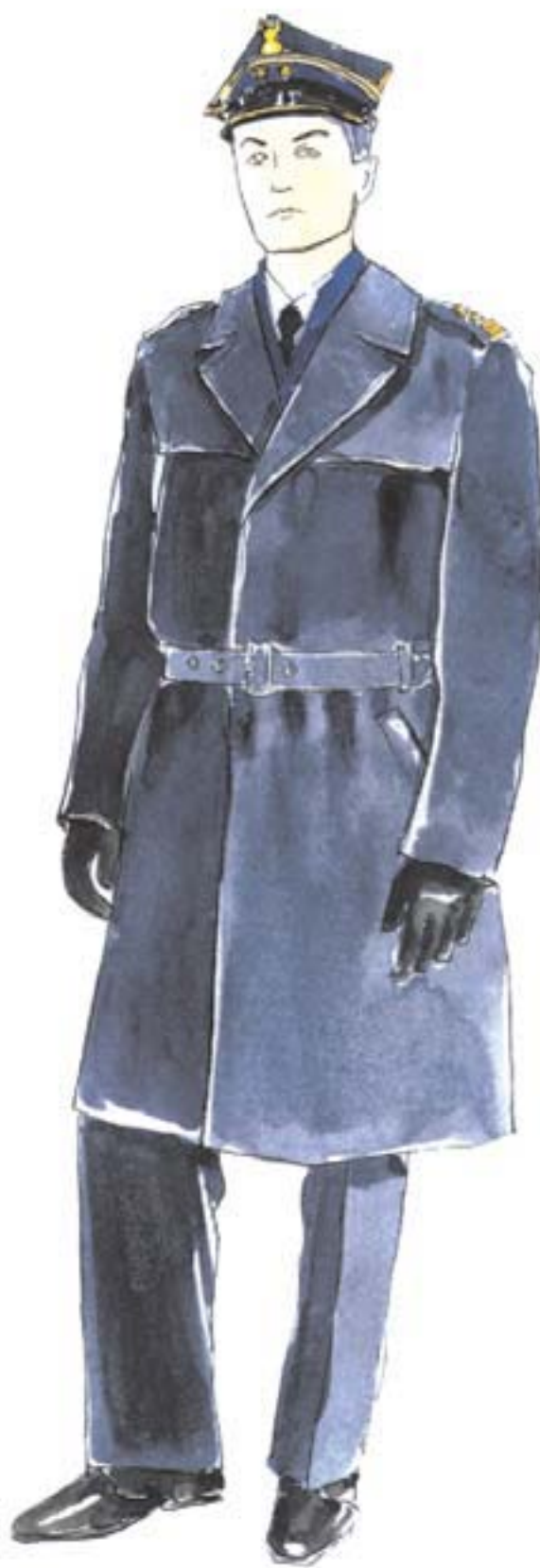
ubiór wyjściowy oficera w płaszczu letnim