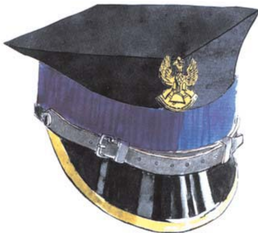
czapka wyjściowa strażaka