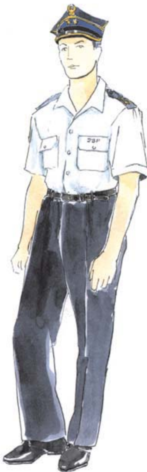
ubiór wyjściowy oficera w koszuli z krótkim rękawem