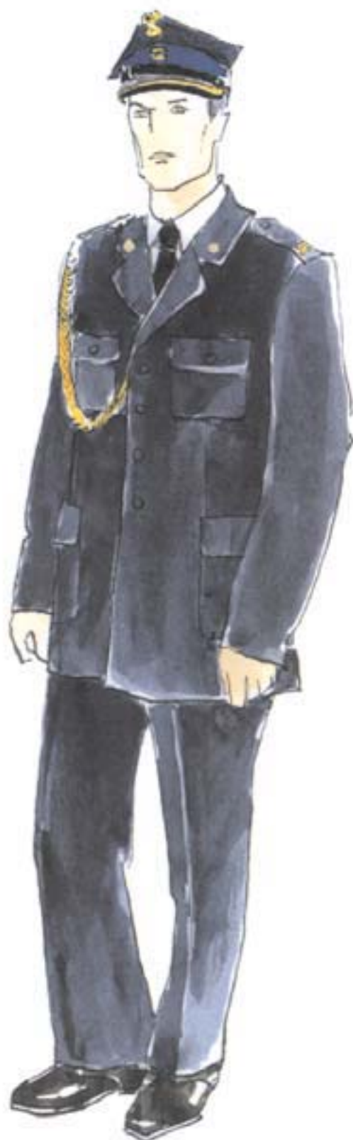
ubiór wyjściowy letni ze sznurem galowym podoficera