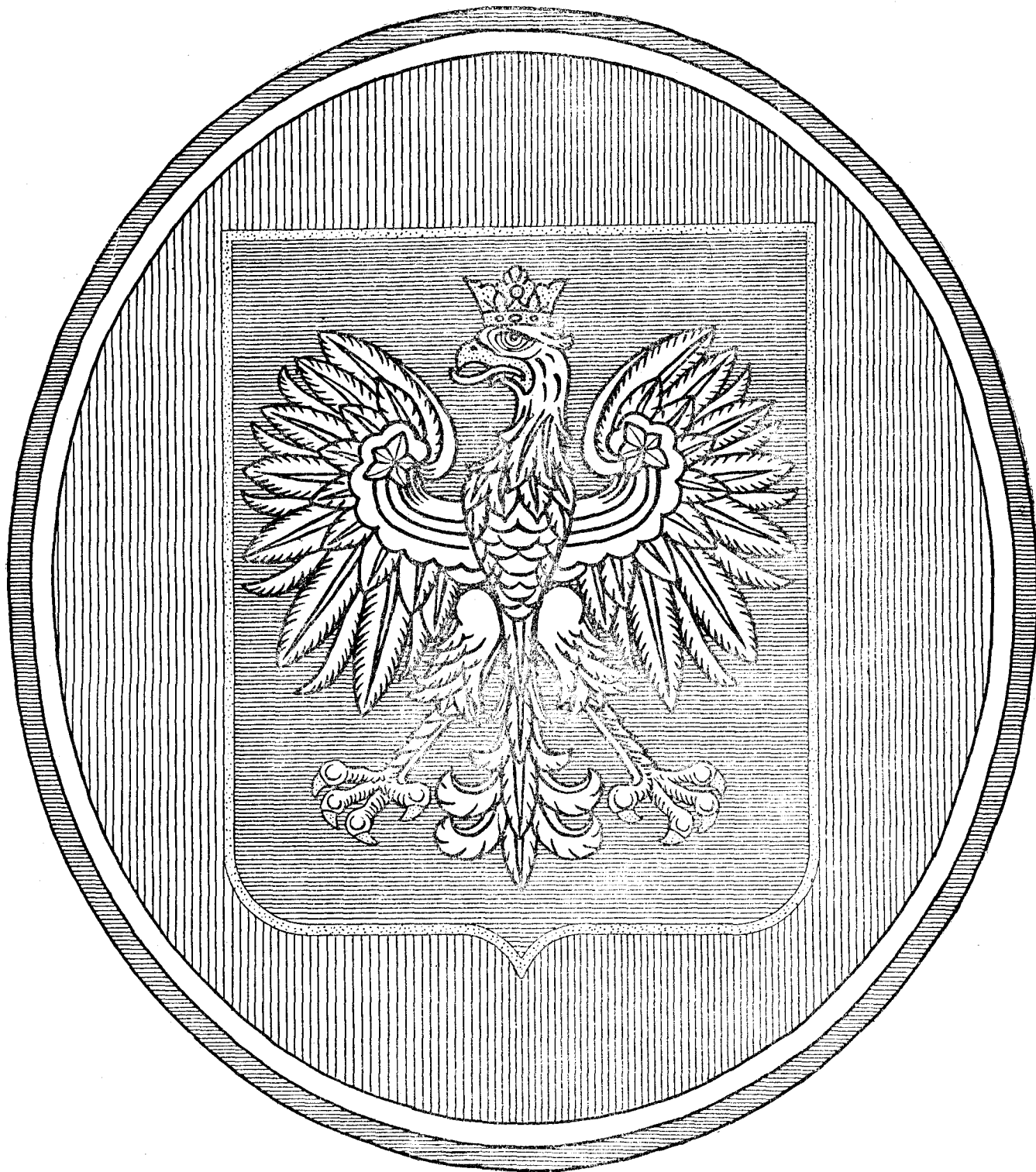
Wzór Nr. 1.

Załączniki do rozp. Prezydenta Rzeczypospolitej z dnia 29 marca 1930 r. (poz. 245).